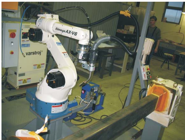
Robot manipulator AX-V6 z MIG/MAG menjalno glavo