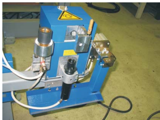
Enota za avtomatsko čiščenje in namaščenje gorilnika + škarje