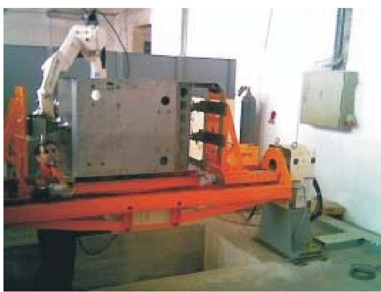
Kombinirana pnevmatsko/mehanska vpenjalna priprava