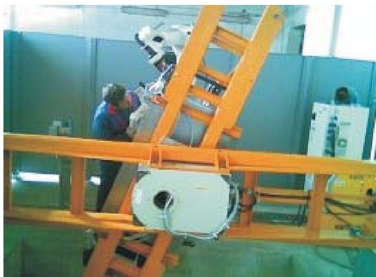
Faza programiranja in varjenja