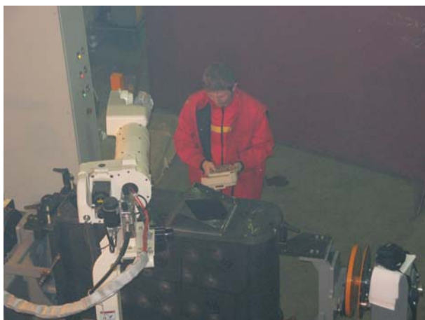
Faza programiranja in varjenja