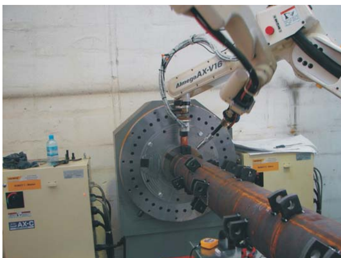
Sinhrono delovanje strega in varjenje z roboti