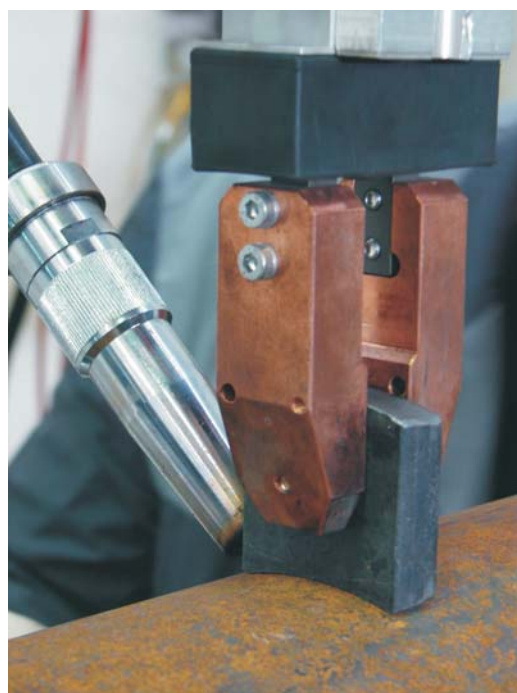
Pnevmatsko vpenjalo in robotski gorilnik