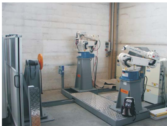
Postavitev opreme robotske varilne celice z robotom manipulatorjem