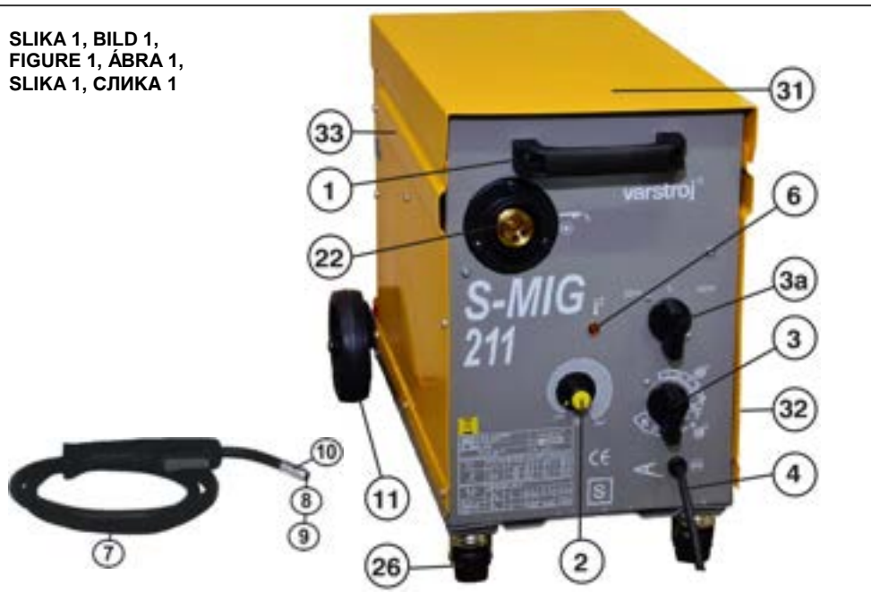
SLIKA 1, BILD 1, FIGURE 1, ÁBRA 1, SLIKA 1, СЛИКА 1